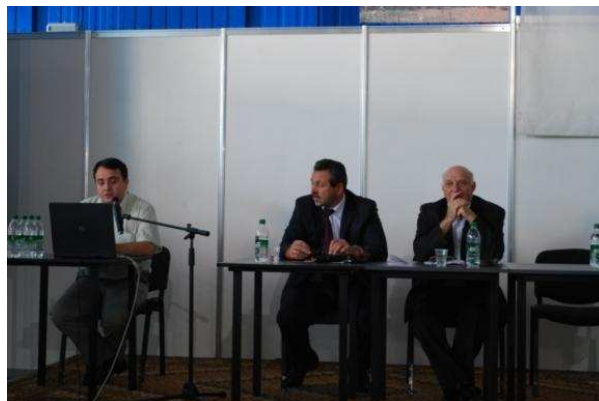
Participare la Conferința științifico-practică „Tehnologii moderne în oncologie” desfășurată în cadrul expoziției internaționale MoldMEDIZINE & MoldDENT 2011 pe 14 septembrie 2011